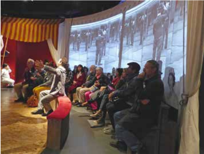
Journée des lecteurs bénévoles à Chaplin's World, 9 septembre 2017.